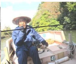
◎遊覧船の船頭さん