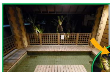
<はわい温泉/恵比寿の湯> 旅館 水郷ナナメ前

恵比寿の湯(左)は、はわい温泉旅館水郷の斜め前にある南欧風の建物がオシャレな足湯です。その裏手のソテツの植栽にソーラーライトを設置し、エキゾチックな魅力がより一層引き立つようになりました。